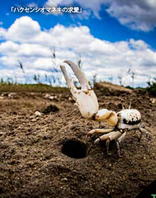
「ハクセンシオマネキの求愛」